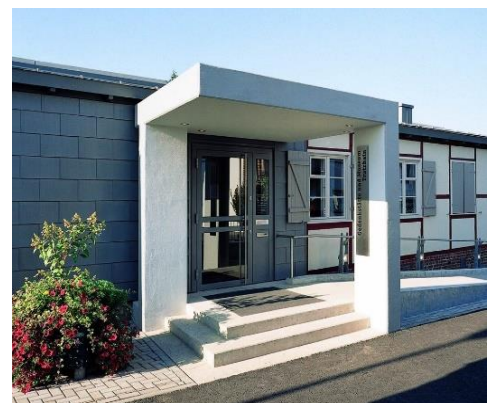
Eingang zur Gedenkstätte (ehem. Wachbaracke)

„Wer seiner Geschichte entfremdet und unwissend gegenübersteht, kann seine Gegenwart nicht verstehen, geschweige denn seine Zukunft fundiert gestalten.“ (Autor unbekannt)