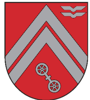
Wappen KpffHubschrRegt 36

und zur historischen Altstadt der Dom- und Kaiserstadt Fritzlar