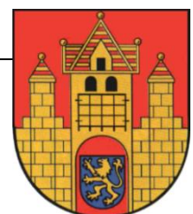
Wappen Bad Frankenhausen