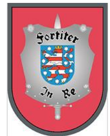
Wappen PzBtl 393

und zur historischen Altstadt von Mühlhausen /Thüringen, laden wir Sie ganz herzlich ein.