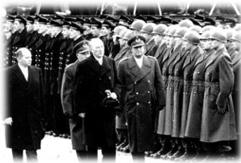
Bundeskanzler Adenauer beim Abschreiten der Front 20.01.56

nach Andernach und Remagen am Samstag, dem 11. Juni 2022 , ein.