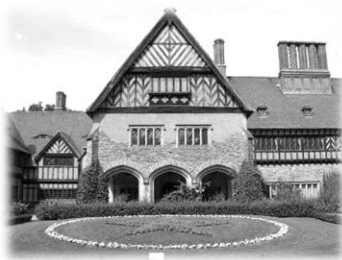
Potsdamer Schloss Cecilienhof Innenhof mit rotem Stern

in die Lüneburger Heide , nach Potsdam und zu den Seelower Höhen im Oderbruch ein.