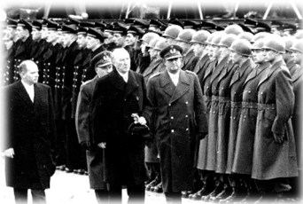
Bundeskanzler Adenauer beim Abschreiten der Front 20.01.56

Anfang Januar 1956 zogen die ersten Freiwilligen der im Zuge der Wiederbewaffnung am 12. November 1955 gegründeten Bundeswehr in das Truppenlager Andernach ein, wo der damalige Bundeskanzler Konrad Adenauer die neuen deutschen Streitkräfte am 20. Januar 1956 offiziell in Dienst stellte. Dieser sog. „ Tag von Andernach “ wurde zum Symbol für die Anfänge westdeutscher Sicherheitspolitik und die Eingliederung der Bundesrepublik Deutschland in die NATO.