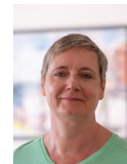
I.E. Alda Vanaga Botschafterin Lettlands Jahrgang 1971, verh. 2 Kinder