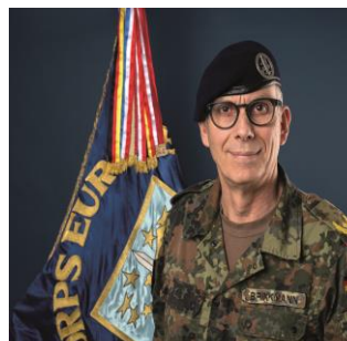
Brigadegeneral Kay Brinkmann Chef des Stabes im Eurocorps